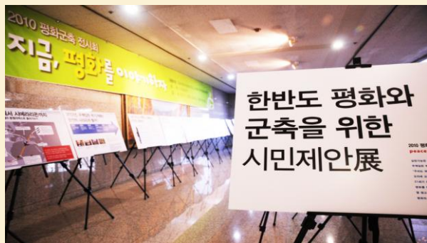
Exhibición de Paz y Desarme del Cabildeo de la Asamblea Nacional de Corea – el anuncio en la derecha anuncia una propuesta de parte de la sociedad civil para la paz y el desarme de la península coreana.

El 18 de noviembre del 2010, activistas de paz de Japón, Corea del Sur, China, los Estados Unidos y de Europa se reunieron en Seúl en una conferencia, y llevar a cabo una sesión de estrategia y cabildeo en la Asamblea Nacional de Corea. El propósito fue de obtener apoyo para la reducción de los gastos militares en la región y de promover la idea de una zona libre de armas nucleares.